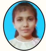
மேக்டலின் ஜெஸி வியாகுல மாதா அன்பியம்