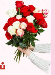
கனப் பணியாளர் சகோ. மனோஜ்